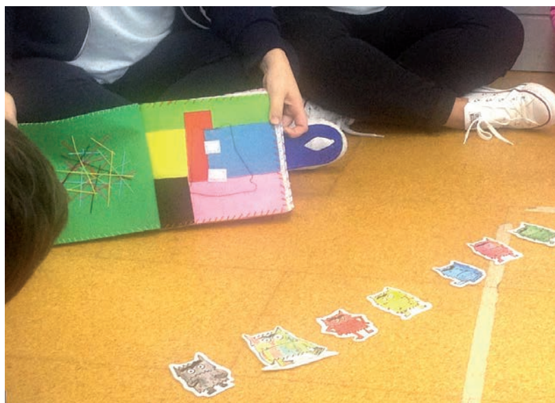
Image 2. Couleurs et émotions