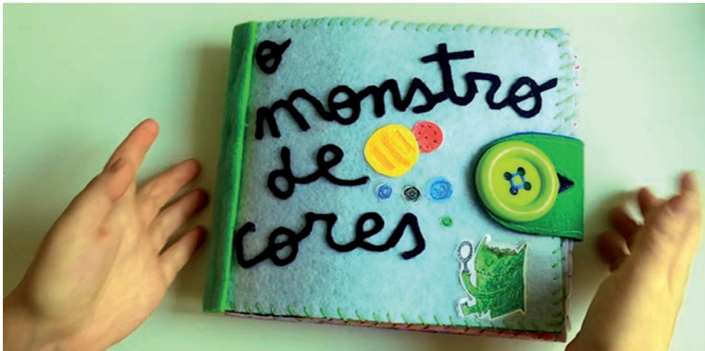
Image 1. La portée du conte adapté